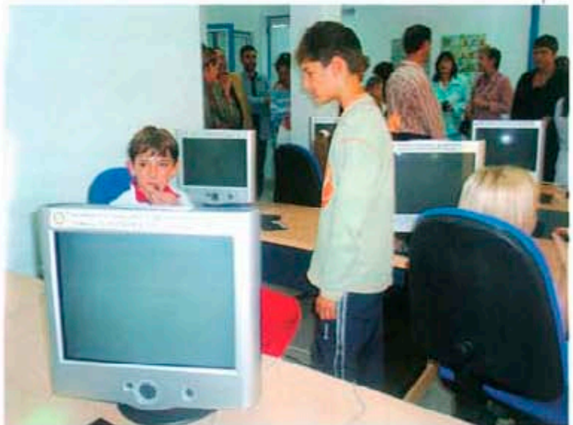
В новооборудвания компютърен кабинет на Центъра за работа с деца в Поморие

Първата копка бе осветена и направена на 25 март 2003 година, на светлия църковен празник Благовещение. В момента проектът е на етап външна мазилка. Изгражда се основно със средства на клуба, а приятелите от побратимени РК - Козани, Гърция, дариха средствата за закупуване на камбана.