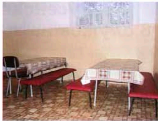
В детската градина в Медово след ремонта